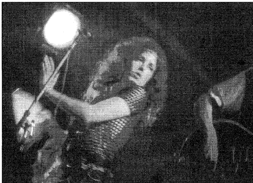
Grace Slick, de legendarische zangeres van Jefferson Airplane, was een van de optredenden tijdens Kralingen.

'Stamping Ground; Holland Pop Festival 35 jaar' in Museum De Dubbelde Palmboom te Rotterdam, Voorhaven 12, van 26 juni tot en met 4 september. Openingstijden: di. t/m vr. 10-17 uur; in het weekend van 11 tot 17 uur. De expositieruimte is gratis te bezoeken. Meer informatie: www.historischmuseumrotterdam.nl en tel. 010-0476 15 33. vende ambiance drie dagen lang in extase te verkeren, waarbij de optredende bands en de walm van pretsigaretten de aanwezigen in vervoering brachten. Het was de tijd van de bloemenkinderen, wier culturele omgangsvormen voornamelijk bestonden uit het bedrijven van de liefde, een oogluikend toegestaan blowtje roken en bellen blazen. Kleine irritaties kregen geen kans uit te groeien tot agressief gedrag, potentiële heethoofden werden gekalmeerd met